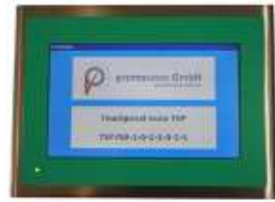
TSP - Touchpanel