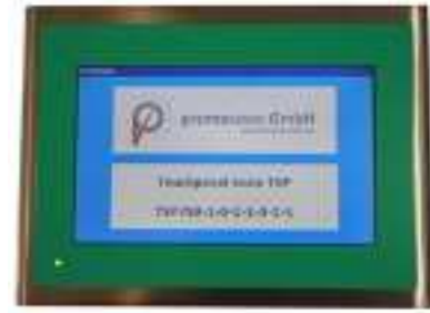
TSP - Touchpanel